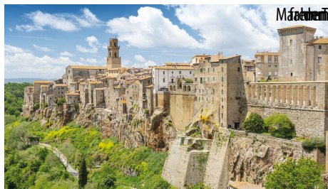
Maremma - die wenig bekannte und schöne südliche Toskana

Die Toskana ist eine der großen Regionen Italiens. Florenz, Pisa, San Gimignano sind bekannte Städte im Norden der Region, der Süden dagegen ist heute immer noch ein Geheimtipp. Südlich der Stadt Siena, abseits der vielbefahrenen Routen liegt die Maremma. Naturbelassene, waldreiche Hügel, Weinfelder und fischreiche Bäche sowie schöne weiße Strände sind ihre Kennzeichen. In den kleinen Dörfchen, die oft hoch über den Tälern auf Tuffsteinhügeln erbaut sind, verbirgt sich die Jahrhunderte alte Geschichte der Etrusker. Die Ruhe und geradezu geheimnisvolle Atmosphäre, die sie ausstrahlen, nehmen den Besucher gefangen.